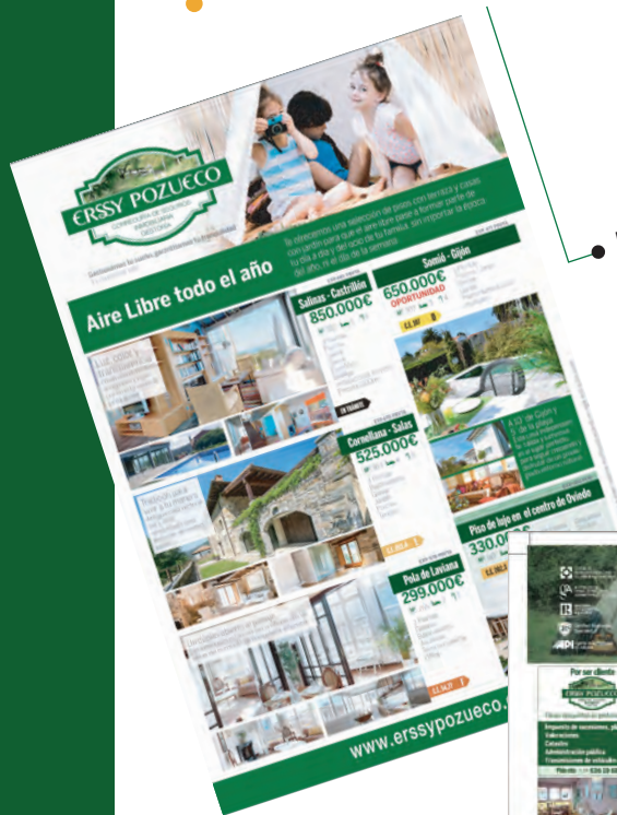
Magazine Erssy Pozuelo