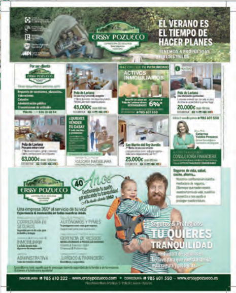
Prensa La Cuenca